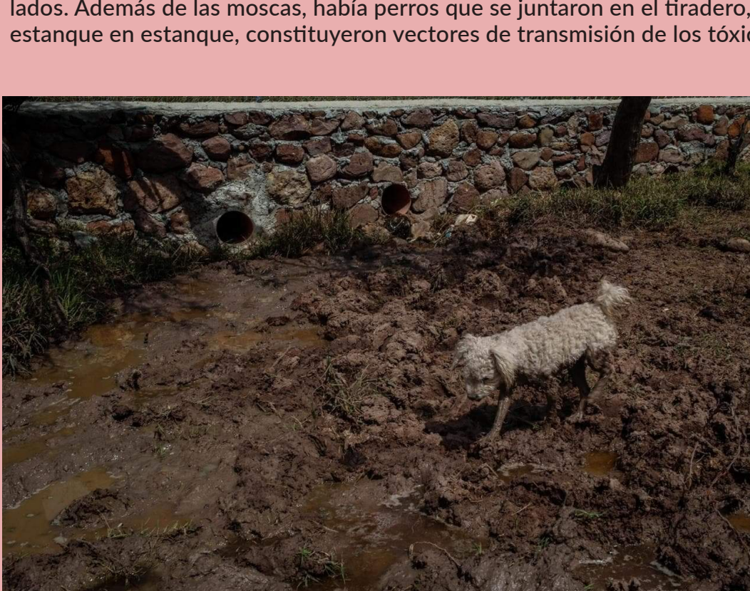
Perro de casa caminando en la zona de lixiviados, afuera del tiradero

Los enjambres de moscas gusaneras infestaron toda la comunidad, lo que impidió llevar nuestra vida habitual. Era imposible cocinar en los exteriores o dejar oreando alimentos, como muchos de nosotros acostumbramos, porque las moscas estaban por todos lados. Además de las moscas, había perros que se juntaron en el tiradero, atraídos por los olores de los animales muertos, y los patos que iban de estanque en estanque, constituyeron vectores de transmisión de los tóxicos depositados en las aguas acumuladas en el basurero.