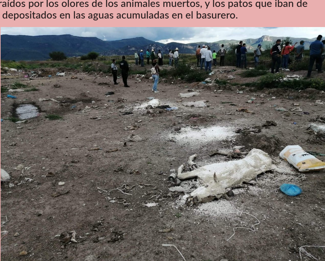
Los animales muertos y otros desechos mezclados, generaron enjambres de moscas panteoneras en todo el pueblo