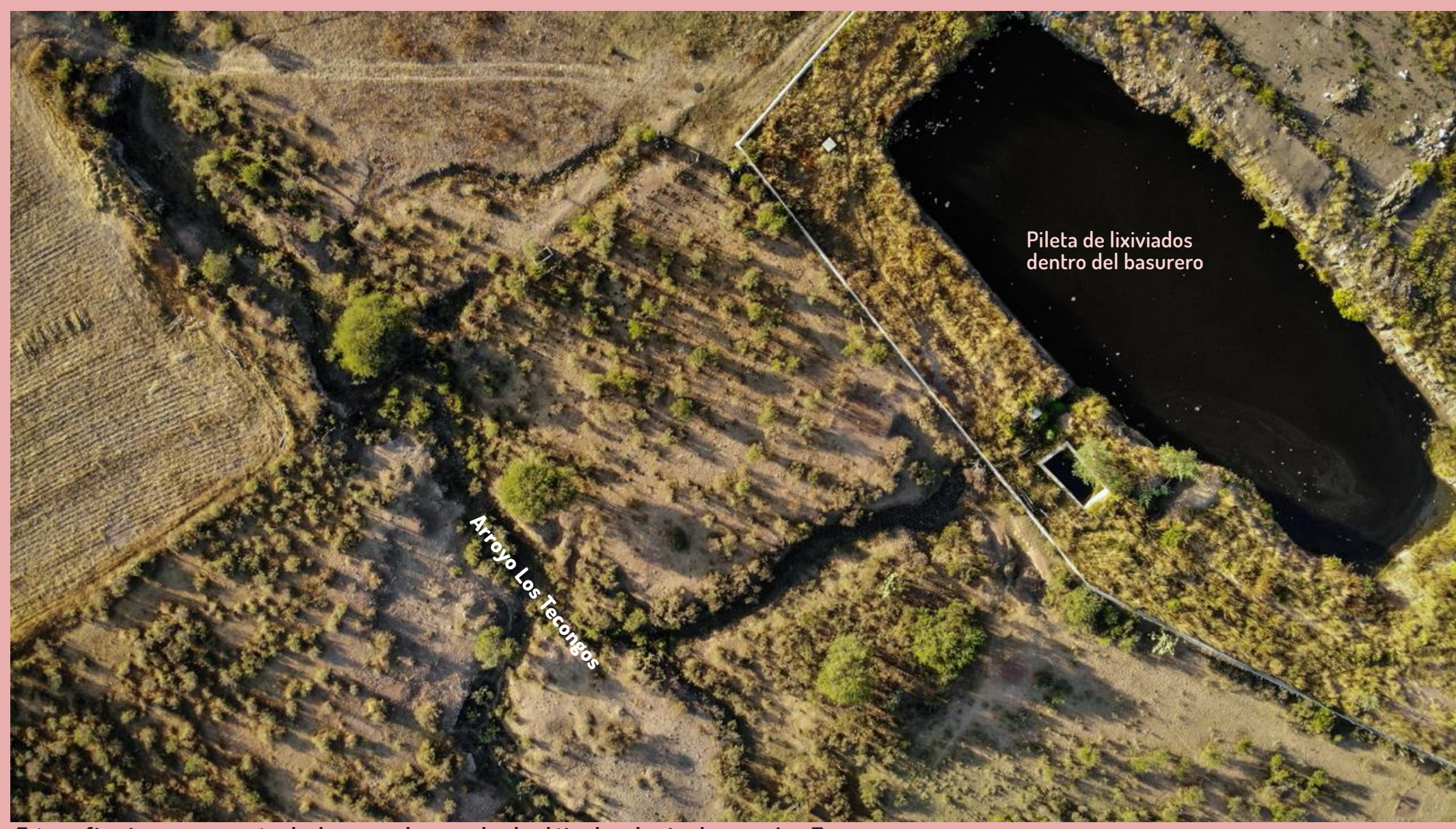
Fotografía aérea que muestra la descarga de agua desde el tiradero hacia el arroyo Los Tecongos

En mayo de 2020, hubo un incendio en el basurero y parte de la geomembrana que debería proteger la contaminación del suelo se quemó. Luego, entre septiembre y noviembre de ese año hubo un brote de hepatitis entre los habitantes aguas abajo del arroyo Los Tecongos. Los habitantes lo asocian con los residuos peligrosos y biológico infecciosos observados dentro del tiradero y los lixiviados que fluieron desde ahí toda la temporada de lluvias. Entre los afectados, hubo niños. Tras el incendio, la membrana protectora del supuesto relleno sanitario se destruyó, por lo que a partir de entonces los lixiviados no sólo fluyen por los tubos, sino también a través del subsuelo, ahora sin protección.