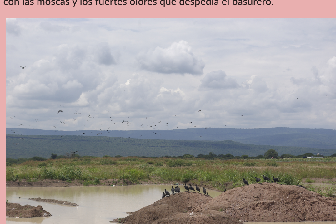
Patos y zopilotes en los estanques, atraídos por los olores putrefactos del basurero

El ganado bebía de las aguas contaminadas con los lixiviados del basurero y nos preocupó la contaminación de los estanques a través de los patos. La infestación de moscas también afectaba al ganado y nos impidió llevar a cabo el trabajo habitual en el campo, lo cual nos trajo daños económicos. Incluso, personas con tierras aledañas al tiradero, como Don Filemón, tuvieron que dejar de producirlos porque no había nadie que pudiera trabajar con las moscas y los fuertes olores que despedía el basurero.