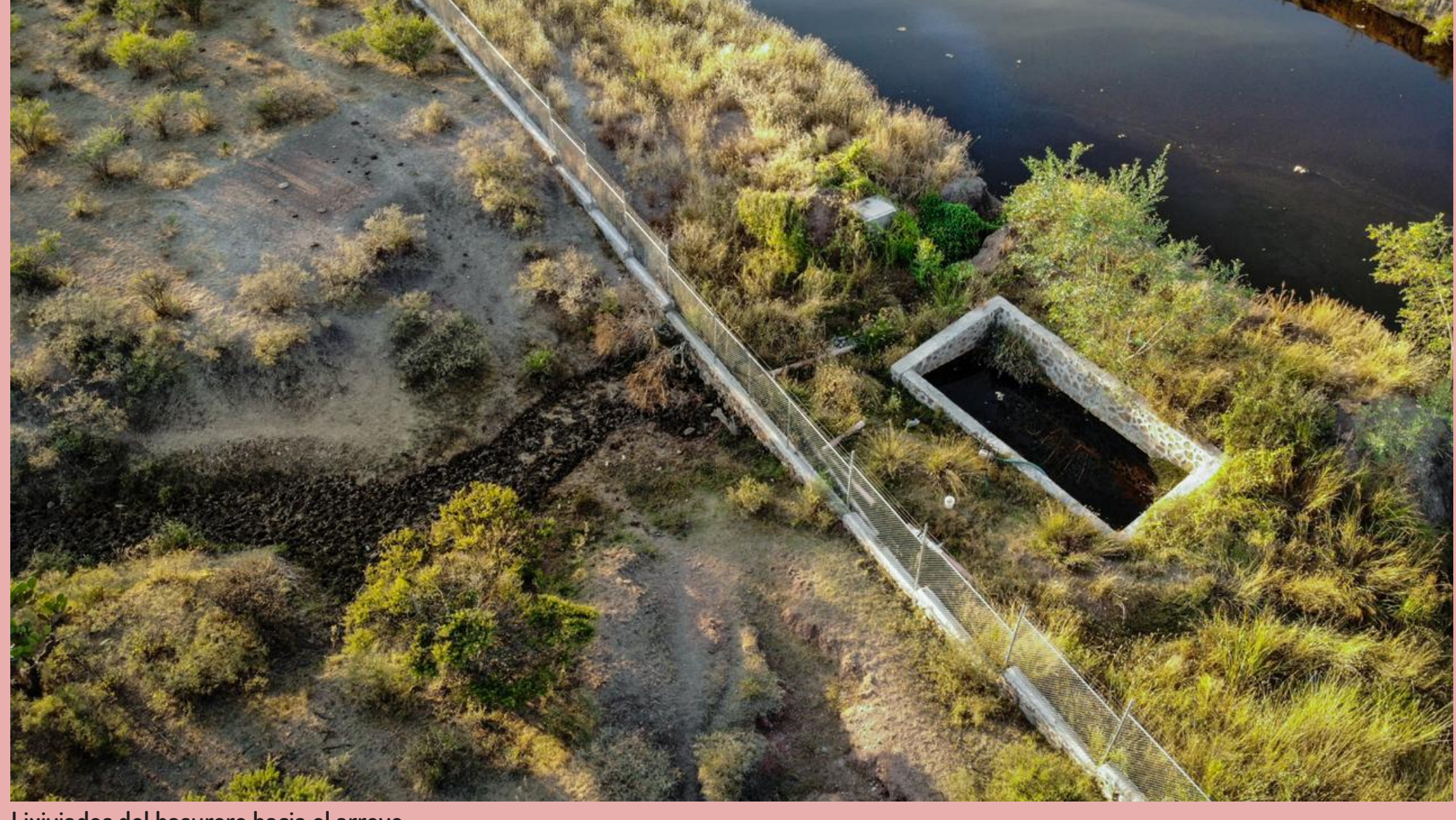
Lixiviados del basurero hacia el arroyo