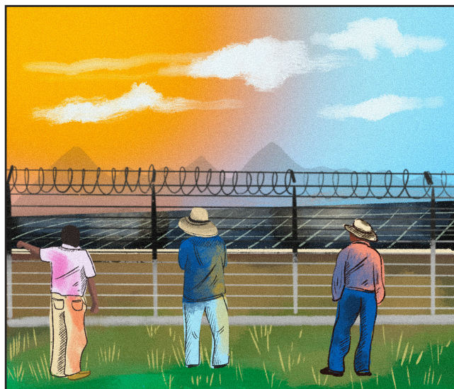
DURANTE SU CONSTRUCCIÓN