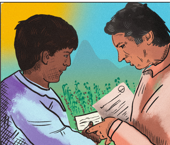
ANTES DE SU CONSTRUCCIÓN